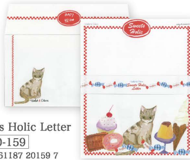
Sweets Holic Letter No.20-159 JAN 4961187 20159 7

美濃和紙便箋 12枚入 145×181mm 美濃和紙封筒 4枚入 94×165mm 単位 5