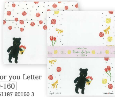
Rose for you Letter No.20-160 JAN 4961187 20160 3