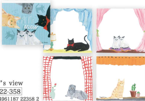
CAT's view No.22-358 JAN 4961187 22358 2