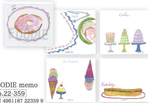
FOODIE memo No.22-359 JAN 4961187 22359 9