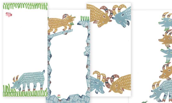
「山羊」 No.20-191 JAN 4961187 20191 7