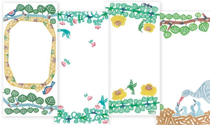
「Bird」 No.20-190 JAN 4961187 20190 0