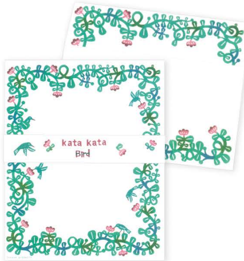
「Bird」 No.20-195 JAN 4961187 20195 5

katakata レターセット ¥450 (税抜価格) 美濃和紙使用 便箋12枚入 181×145mm 封筒4枚入 94×165mm 単位5 7月中旬発売予定